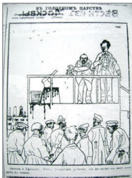
FIGURE 3. MAD, 19 juin 1920, « Dans le royaume de famine » in La Cause commune .

ayant eu lieu en juin 1907, et auquel, selon certaines sources, le futur dictateur soviétique a participé. MAD en parlera à nouveau, plus tard, et cette fois-ci d'une façon ouvertement accusatrice dans le numéro spécial de la revue CILACC ( Centre international de lutte active contre le communisme ) parue en Belgique en avril 1937 19 . Sur la couverture de cette revue, le Staline de MAD est déguisé en Thémis, la déesse grecque de la justice, avec une épée ensanglantée et une balance, dont l'un des deux plateaux suspendus à un fléau est rempli de sang et penche vers le bas. À travers cette métaphore, le caricaturiste fait comprendre qu'aucune équité n'existe en URSS (fig. 6).