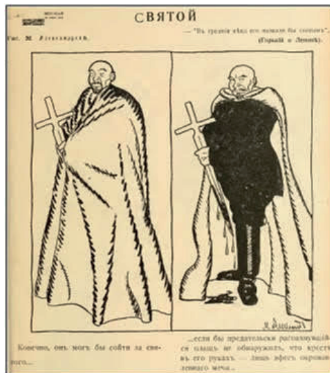
FIGURE 5. Alexandrov, 1920, « Un saint » in Bitche , n° 8. « Au Moyen Âge, on aurait pu l'appeler un saint (Gorki parlant de Lénine). » « Bien sûr, il aurait pu passer pour un saint... si sa cape, qui s'était ouverte, ne l'avait pas trahi : il s'est avéré que la croix dans ses mains n'était qu'une poignée d'épée ensanglantée... »