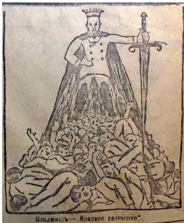
FIGURE 2. Sans nom, 7 janvier 1918, « Vladimir, le Soleil Rouge » in Le Beau Matin 13 .