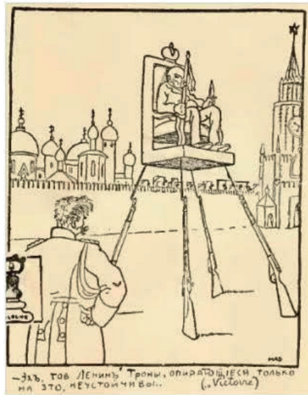
FIGURE 4. MAD, 1920, sans titre in Bitche [Le Fouet], n° 6. « Ah, camarade Lénine, les trônes qui ne s'appuient que sur cela, sont instables... »